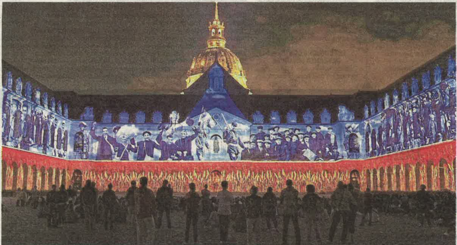
À la tombée de la nuit l'édifice prend vie pour nous raconter une histoire... La sienne.

Quoi : « La Nuit aux Invalides : Lutèce, 3 000 ans d'histoires ». Où : esplanade des Invalides, 129, rue de Grenelle (VII e ). Quand : du mercredi au samedi jusqu'au 30 août. À partir de 22 h 30 en juillet, 22 heures en août. Combien : De 15 à 25 €, gratuit pour les enfants de moins de 7 ans.